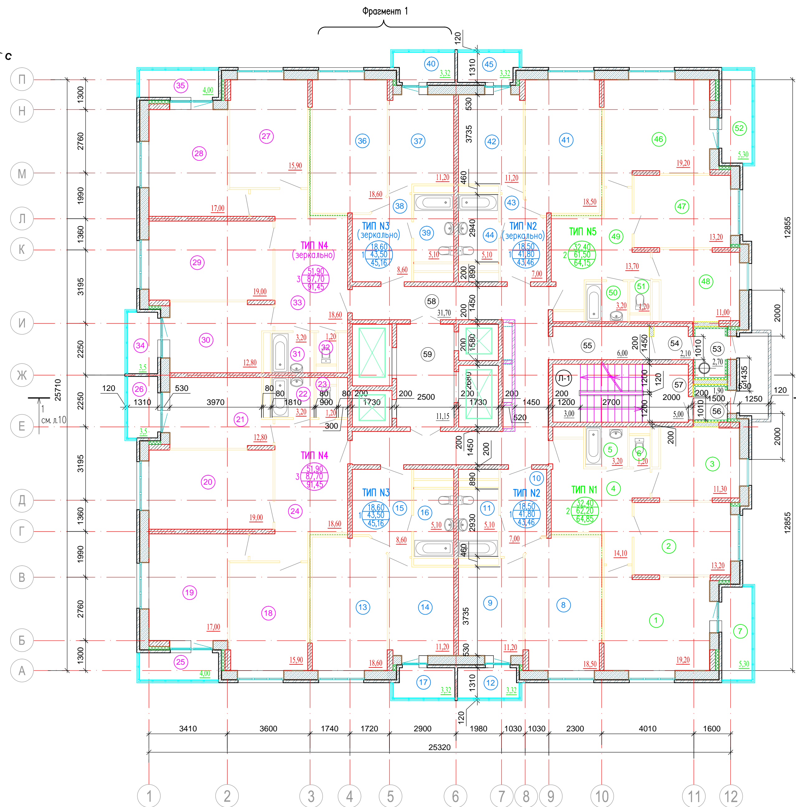
ЭКСПЛИКАЦИЯ ПОМЕЩЕНИЙ (начало)